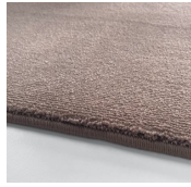
Tea Rose Amazing Grey