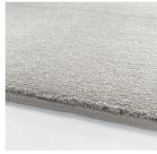
Simply White Simply White