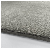
Amazing Grey Tea Rose