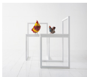
FRONZONI 64' chair