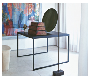
FRONZONI 64' table