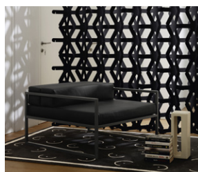
FRONZONI 64' armchair