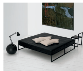
FRONZONI 64' bed