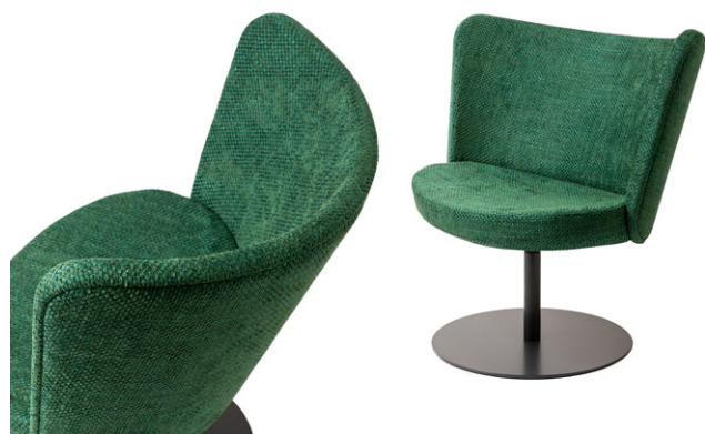
poltroncina girevole - swivel armchair

California Technical Bulletin 117 - 2013, Sez. A part 1, Sez D part 2.