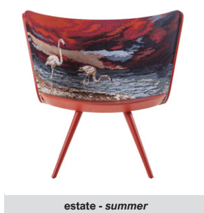
estate - summer