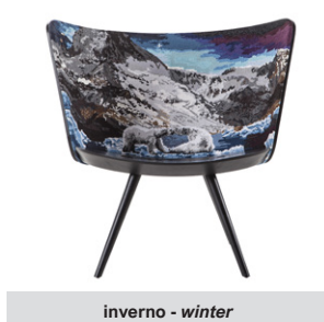
inverno - winter