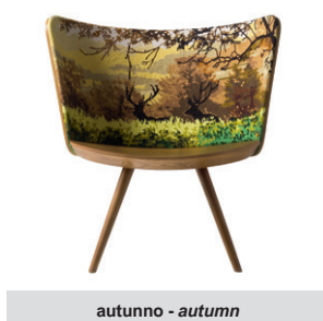
autunno - autumn