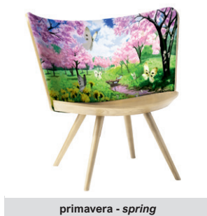
primavera - spring