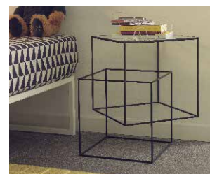
THIN BLACK TABLE

Lucky | Peg Bed | Peg Chair | Koeda | Tuta | Waku