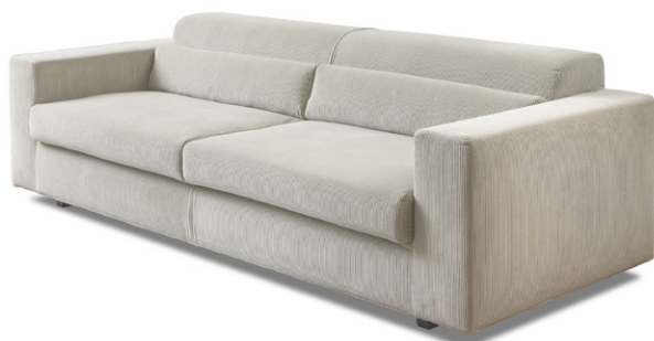
PETIT QUACK 2020

California Technical Bulletin 117 - 2013, Sez. A part 1, Sez D part 2.