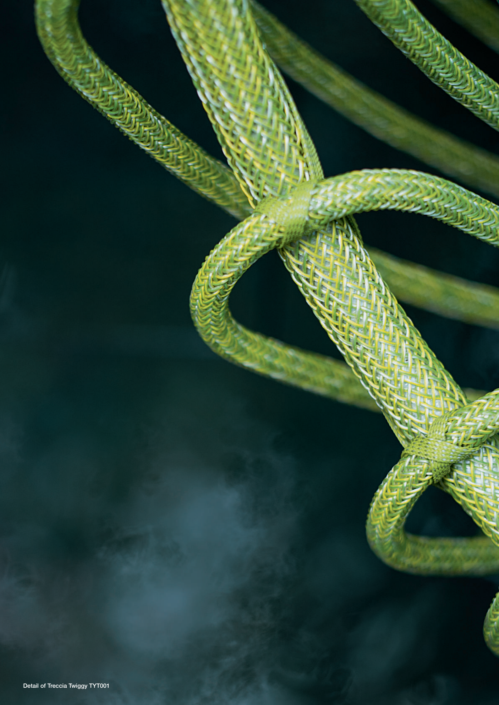
Detail of Treccia Twiggy TYT001