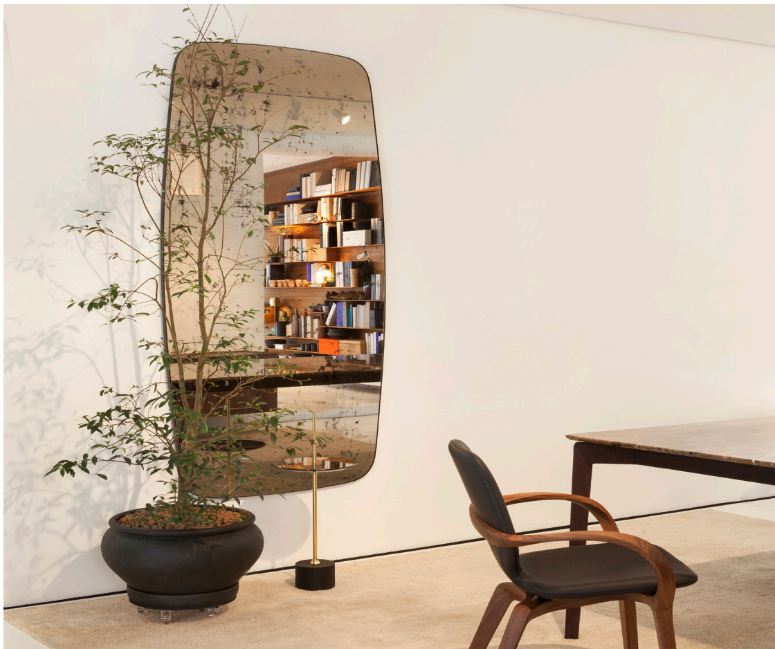
BASEL designed by Jader Almeida 2016