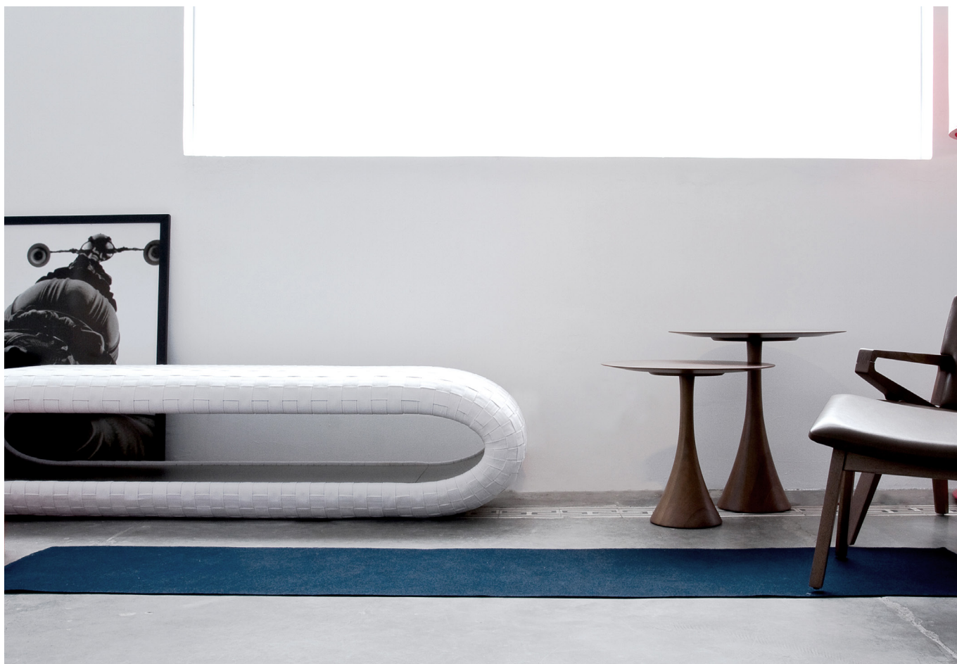
CHEIG designed by Jader Almeida